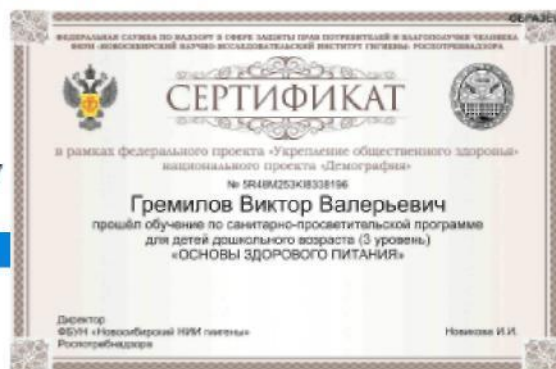
Рис. 15. – Просмотр результатов итогового тестирования и получение сертификата, подтверждающего успешность прохождения обучения

В случае если набрано менее 80% правильных ответов, Программа указывает проблемные разделы и предлагает пройти тестирование повторно. Количество повторных тестирований не ограничено по количеству, но ограничено по времени. Повторное тестирование можно пройти не ранее чем через 24 часа от предыдущего тестирования.